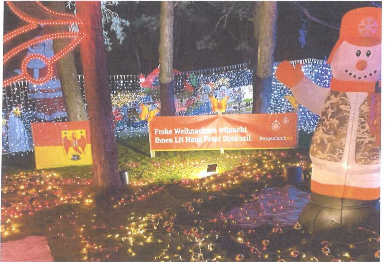
Foto beim Weihnachtsdorf Bad Tatzmannsdorf